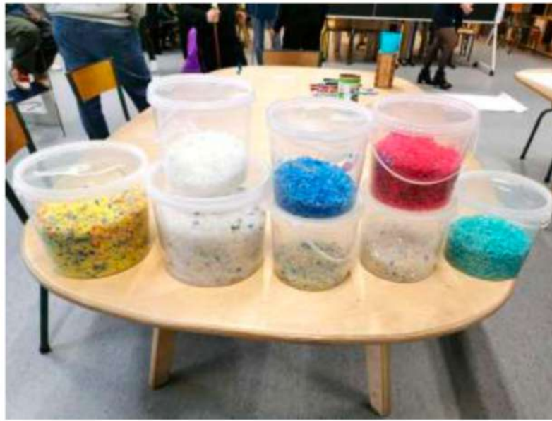
Bibliothèque de plastiques de laboratoire