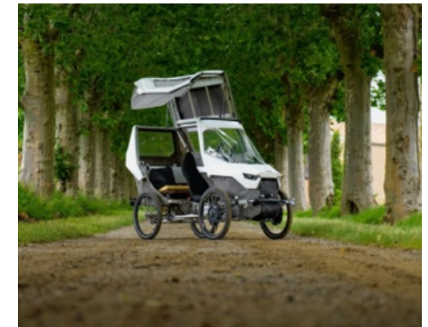
QBX Sorean (45km/h)