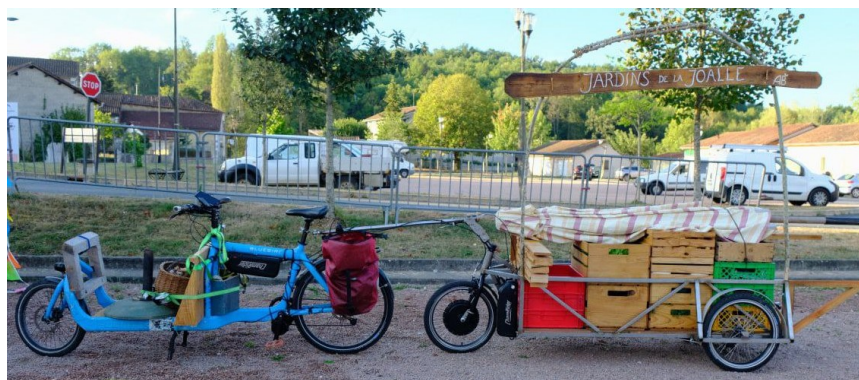
VAE + remorque motorisée